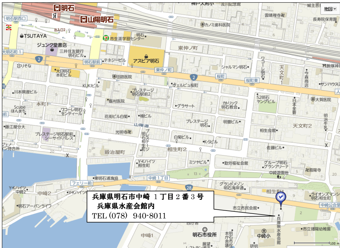
【第1回 勉強会会場案内図】